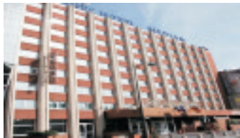
Hotel Median Paris Congrès ***S