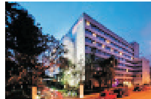
Hotel Möwenpick Paris Neuilly ****S - (Porte Maillot)